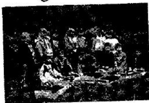
Un groupe de vendangeurs

LE VIGNERON DU PUECH SEIZOU " Les v's de Laguenne qu'el pas de la pléyato "