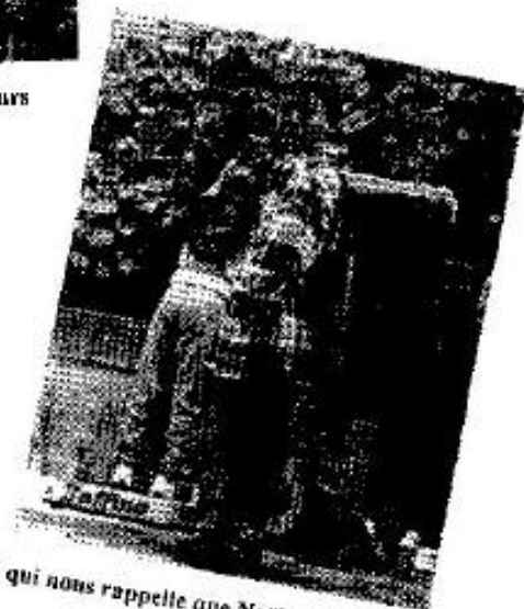
Une botte qui nous rappelle que Noël n'est pas loin ...