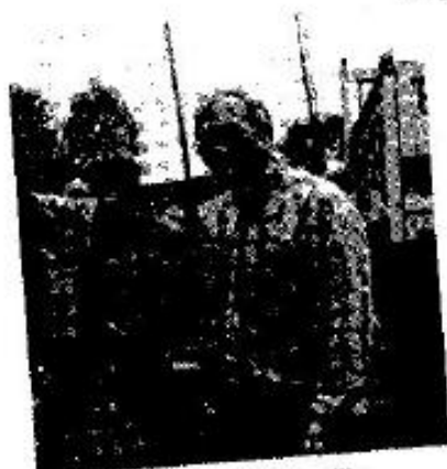
Le maître de chai veille ...