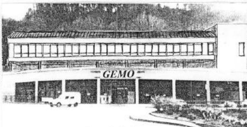
Perspective des bureaux

Grâce à la maîtrise des terrains provenant de l'achat des immeubles LAUMOND, un magasin "GEMO" s'est installé, créant 5 emplois. Une implantation de bureaux avec parking viendra bientôt compléter cette réalisation. Ces nouveaux locaux seront destinés à recevoir la Compagnie d'Assurance "MAIF".