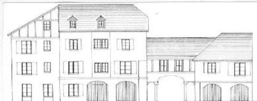
FACADE sur rue des ARMURIERS

L'opération sera réalisée par l'Office Public Départemental d'HLM. Le permis de construire a déjà été déposé. Les personnes intéressées par la location peuvent d'ores et déjà s'inscrire auprès de la mairie.