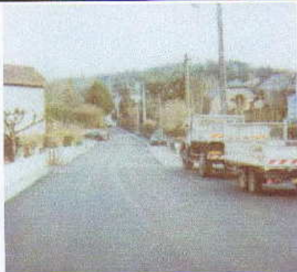
Enrobé rue des Prairies

Les études doivent être réalisées cette année, les travaux s'effectueront, sauf imprévu, en 2004-2005.