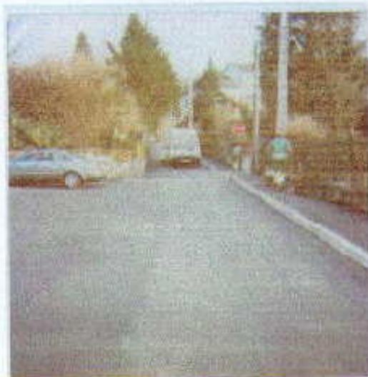
Rue des Prairies

Il est bien évident que ces décisions ont été prises par le conseil municipal à une large majorité, en toute impartialité, dans le seul but d'assurer au maximum la sécurité des usagers sans privilégier les uns ou léser les autres.