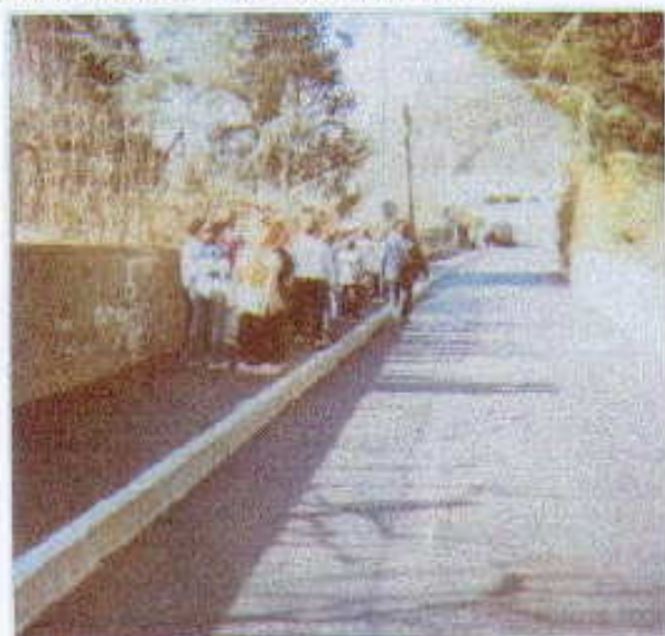
Trottoirs rue des Prairies

En ce qui concerne le Pont Noir, sa réouverture a été décidée (le 11 février 2003) afin de faciliter un accès plus direct aux riverains. Cet ouvrage vétuste, ne pouvant plus supporter le flot important de voitures, fourgons et caravanes l'empruntant précédemment chaque jour, nous espérons que la nouvelle signalisation limitera les passages de véhicules. Le conseil municipal, conscient du fait que ce nouveau plan de circulation bouleverse quelque peu les habitudes des usagers, espère que le bon sens et le civisme de chacun prévaudront et qu'une fois le moment de mécontentement surmonté, les guennois comprendront le bien fondé de ces aménagements.