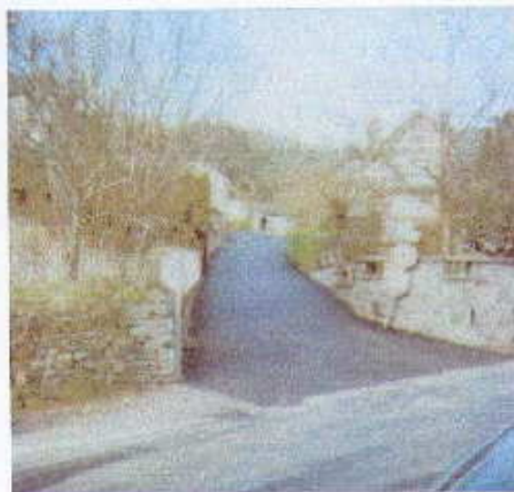
Enrobé côte de Pujol

Une plainte a été déposée auprès de la gendarmerie pour vol de panneaux de circulation et de fleurs sur la commune. Cette affaire serait en phase d'aboutir. Le manque de civisme et de respect des installations est malheureusement à déplorer chaque jour davantage.